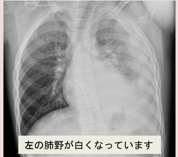
左の肺野が白くなっています

何らかの原因で、肺の周りの胸腔という空間に細菌などの微生物が入り膿のたまりをつくる病気です。