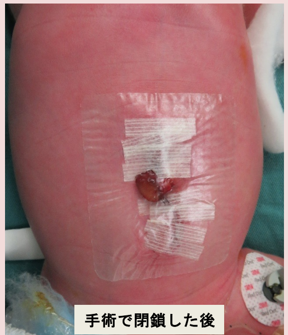
手術で閉鎖した後

脱出臓器が小さいときは、一回の手術で臓器をおなかに戻し腹壁を閉じることが出来ます。しかし脱出臓器が大きいときは、一回の手術でおなかに入れることが出来ません。その場合は、さまざまな方法で少しずつおなかに戻していきます。