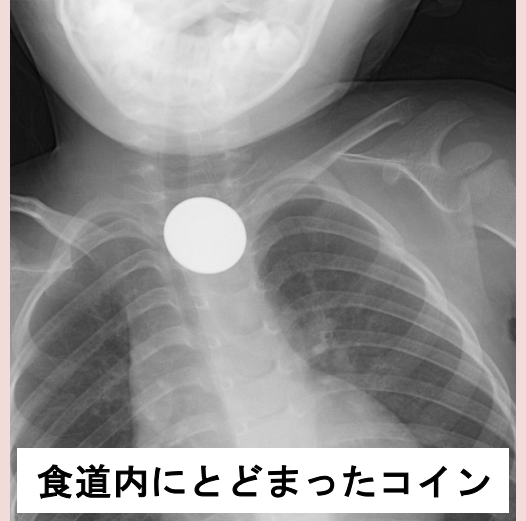
食道内にとどまったコイン

異物が食道内にとどまっていれば、食道の通過障害を起こし、水・食べ物を飲み込むことが困難になります。異物が胃の中まで落ちていれば、特に症状はありません。