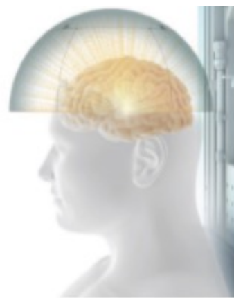
レボドパ・カルビドパ 経腸用液療法 LCIG