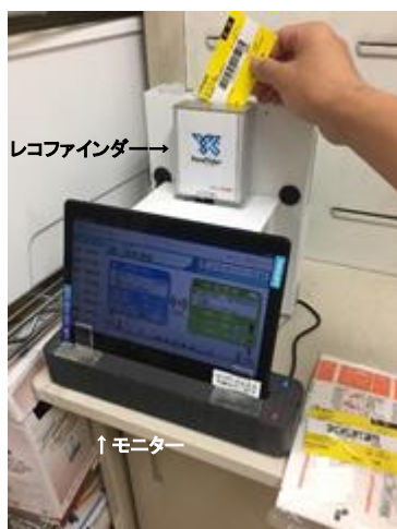
「レコファイnder」とモニター