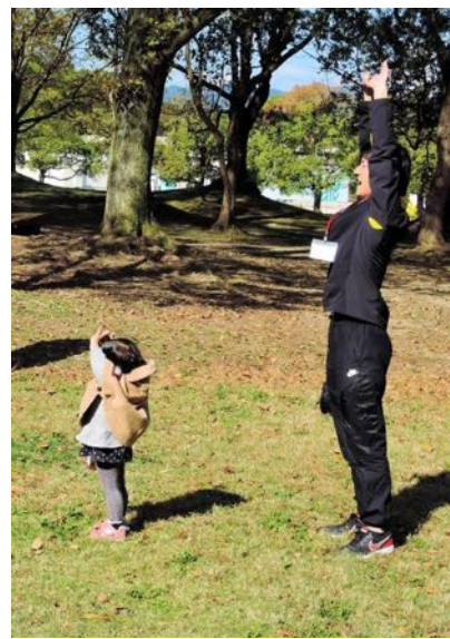
体操指導する沼尾先生親子