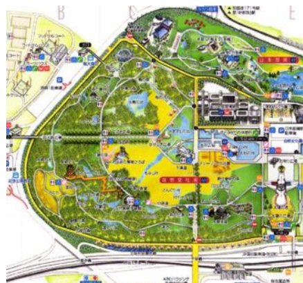
万博記念公園地図