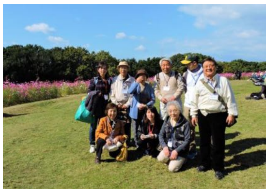
花の丘にて休憩中（B班）