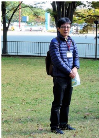
開催の挨拶 猪子先生